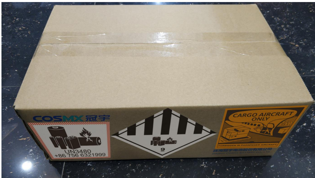
外包装 Outer Package