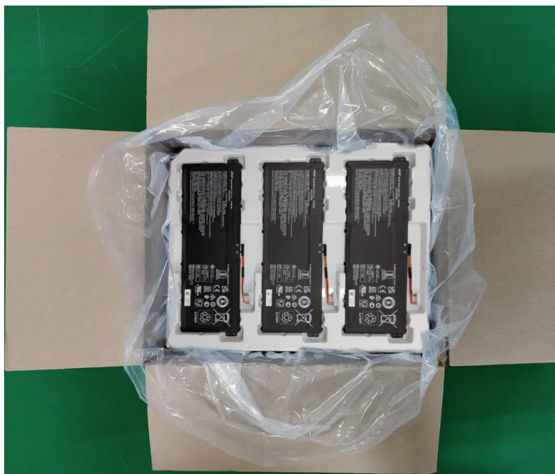
内包装 Inner Package